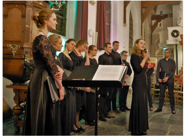
Kerstconcert met het Young Chamber Choir

Het laatste concert dat door de Stichting Vrienden Dorpskerk Westmaas werd georganiseerd betrof een kerstconcert op zaterdagavond 15 december.