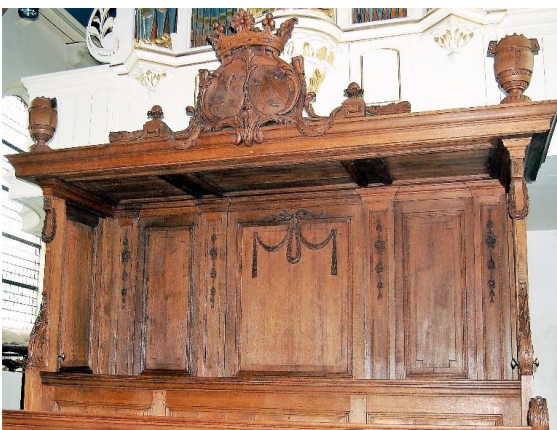
De herenbank die bij de ingang van de kerk staat.

Voorts zijn er aan de noordelijke muur versieringen aangebracht. Een cartouche over de eerste steenlegging met een wapenschild en een reliëf die de kerk en de toren direct na de bouw in 1650 moet voorstellen. Hierop staan de namen van bouwmeester en die van de kerkmeester vermeld.