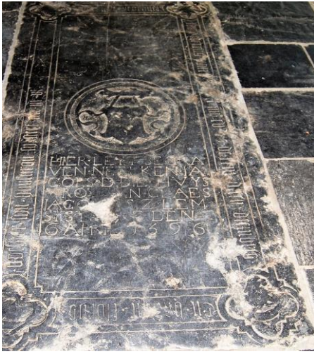
Grafsteen uit 1596. Vorig jaar is hiervan een foto verstuurd aan een belangstellende die hiernaar geïnformeerd had.

bracht. Na de restauratie van de kerk werd in 1968, dankzij de financiële medewerking van de inwoners van Westmaas, een carillon met 18 luidklokken aangebracht.