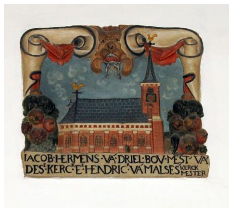
De cartouche aan de noordmuur van de kerk over de eerste steenlegging.

Op 13 augustus 2014 is de Stichting Vrienden Dorpskerk Westmaas opgericht met als doel dit monumentale gebouw voor het dorp Westmaas te behouden. Want met de woning aan de Munnikweg, die tot 1962 als pastorie in gebruik was, de molen Windlust en de boerderij Marienhof aan de