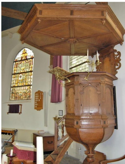
De preekstoel uit 1650. Hieraan bevinden zich de koperen lezenaar, een kaarsenhouder, een zandloperhouder en een doopbekkenhouder.

Naast opbrengst uit activiteiten vormen de bijdragen van de (bedrijfs)vrienden een belangrijke basis van onze jaarlijkse inkomsten. Om dat draagvlak te vergroten heeft het bestuur zich een paar jaar geleden als doel gesteld te streven naar zo'n 400 vrienden. Dat betekent dat wij zoveel mogelijk inwoners uit Westmaas moeten benaderen met de vraag of zij "Vriend" willen worden. Eind 2021 waren dat er 218 (exclusief zes bedrijfsvrienden), dus zijn we op de goede weg. Het zou mooi zijn wanneer u, als vriend van de Stichting Vrienden Dorpskerk Westmaas, probeert uw burens, familie en vrienden te benaderen of zij zich bij ons als vriend willen aansluiten. De minimumbijdrage om Vriend te worden is € 10,00 per jaar. Wij hopen dat u ons op die manier in de komende jaren helpt om dat doel te bereiken.